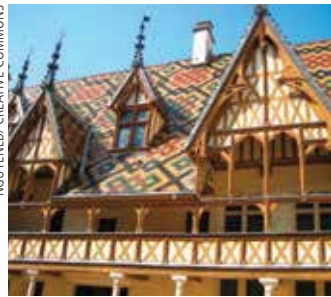
Hôtel-Dieu de Beaune.