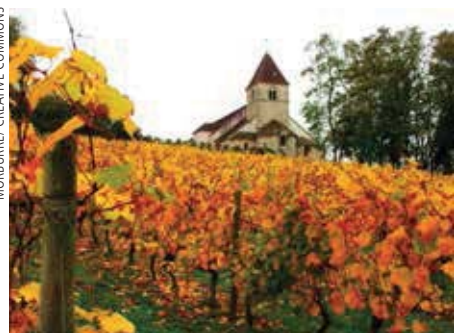
L'église de Vergy dans les vignes.

d'hommes et de femmes qui, au fil des siècles, se sont mis au service des malades indigents : sœurs hospitalières, administrateurs, bienfaiteurs, apothicaires, médecins. Parmi eux, les hospices de Beaune et l'hôtel-Dieu de Tonnerre, devenus aujourd'hui des musées, comptent parmi les monuments les plus célèbres. L'hôtel-Dieu de Beaune est le site principal des célèbres hospices fondés en 1443 par Nicolas Rollin, chancelier du duc de Bourgogne. C'est