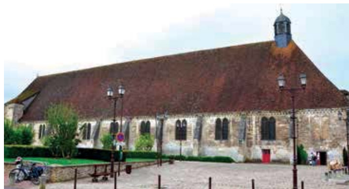
Hôtel-Dieu de Tonnerre.

C'est ainsi que, par acquisitions ou donations, vont naître les domaines viticoles de Côteaux, Meursault, Clairvaux, Vougeot qui deviendra au fil des transformations le « Clos de Vougeot » et qui est considéré aujourd'hui comme le plus emblématique des grands crus. Depuis 1944, le domaine abrite la fameuse confrérie des Chevaliers du Tastevin. D'années en années, achetées, données ou louées, d'autres propriétés viendront agrandir les possessions des moines : Nuits, Vosne, Volnay, Pommard, Fixin, Corton. L'énoncé de ces terrains possédés